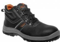
BNN BASIC S3 High Z93201 EN ISO 20345 S3