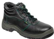
ADM CLASSIC O2 Winter High C30219 EN ISO 20347 O2 SRC FO