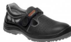
BNN BASIC O1 Sandal Z90001 EN ISO 20 347 O1