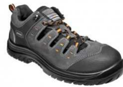
ADM ASTON S1 Sandal C41026 EN ISO 20345 S1 SRC