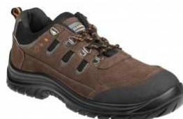
ADM BAXTER O1 Low C20117 EN ISO 20347:2012 O1 SRC FO