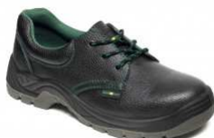
ADM CLASSIC S1 Low C91122 EN ISO 20345 S1 SRC