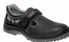
BNN BASIC S1 Sandal Z91001 EN ISO 20345 S1