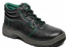
ADM CLASSIC O1 High C90221 EN ISO 20347 O1 SRC

Klasické modely osvědčené pracovní a bezpečnostní obuvi v letním i zimním provedení pro použití ve vnitřních i venkovních provozech. Kolekce CLASSIC reaguje na aktuální poptávku pracovní obuvi v rozumné kvalitě za atraktivní cenu.