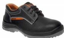
BNN BASIC O1 Low Z90101 EN ISO 20347 O1