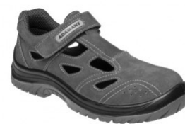
ADM TAYLOR S1 C41024 EN ISO 20345 S1 SRC