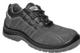
ADM SPENCER S1P C41125 EN ISO 20345 S1P SRC