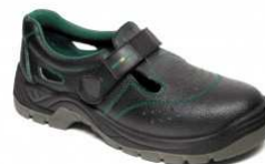
ADM CLASSIC S1 Sandal C91023 EN ISO 20345 S1 SRC