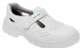
ADM WHITE O1 Sandal C10006 EN ISO 20347 O1 SRC