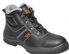
BNN BASIC O2 Winter High Z90203 EN ISO 20347 O2 CI