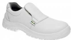
ADM WHITE S1 Moccasin C21115 EN ISO 20345 S1 SRC