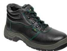
ADM CLASSIC S3 Winter High C33220 EN ISO 20345 S3 SRC