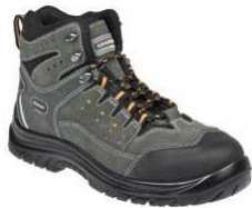
ADM ASTON S1P High C41228 EN ISO 20345 S1P SRC