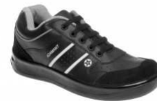
ADM RAPIDO OB Black C10109 EN ISO 20347 OB