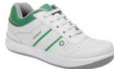
ADM RAPIDO OB White C10108 EN ISO 20347 OB