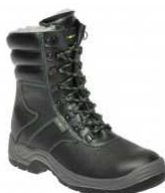
ADM CLASSIC S3 Winter Boot C93890 EN ISO 20345 S3 SRC