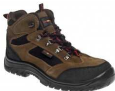
ADM BAXTER O1 High C20216 EN ISO 20347 O1 SRC