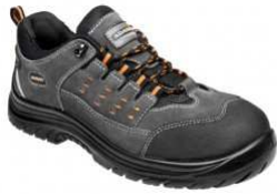
ADM ASTON O1 Low C40127 EN ISO 20347 O1 SRC FO