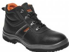
BNN BASIC O1 High Z90201 EN ISO 20347 O1

Kolekce BENNON BASIC nabízí základní modely pracovní i bezpečnostní obuvi na podešvích PU/PU vyrobené s využitím materiálů vyšší kvality. Bezpečnostní varianty jsou vybaveny ocelovou tužinkou a planžetou. V kolekci najdete sandál, polobotku a kotníkovou obuv.