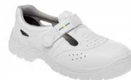
ADM WHITE S1 Sandal C11006 EN ISO 20345 S1 SRC