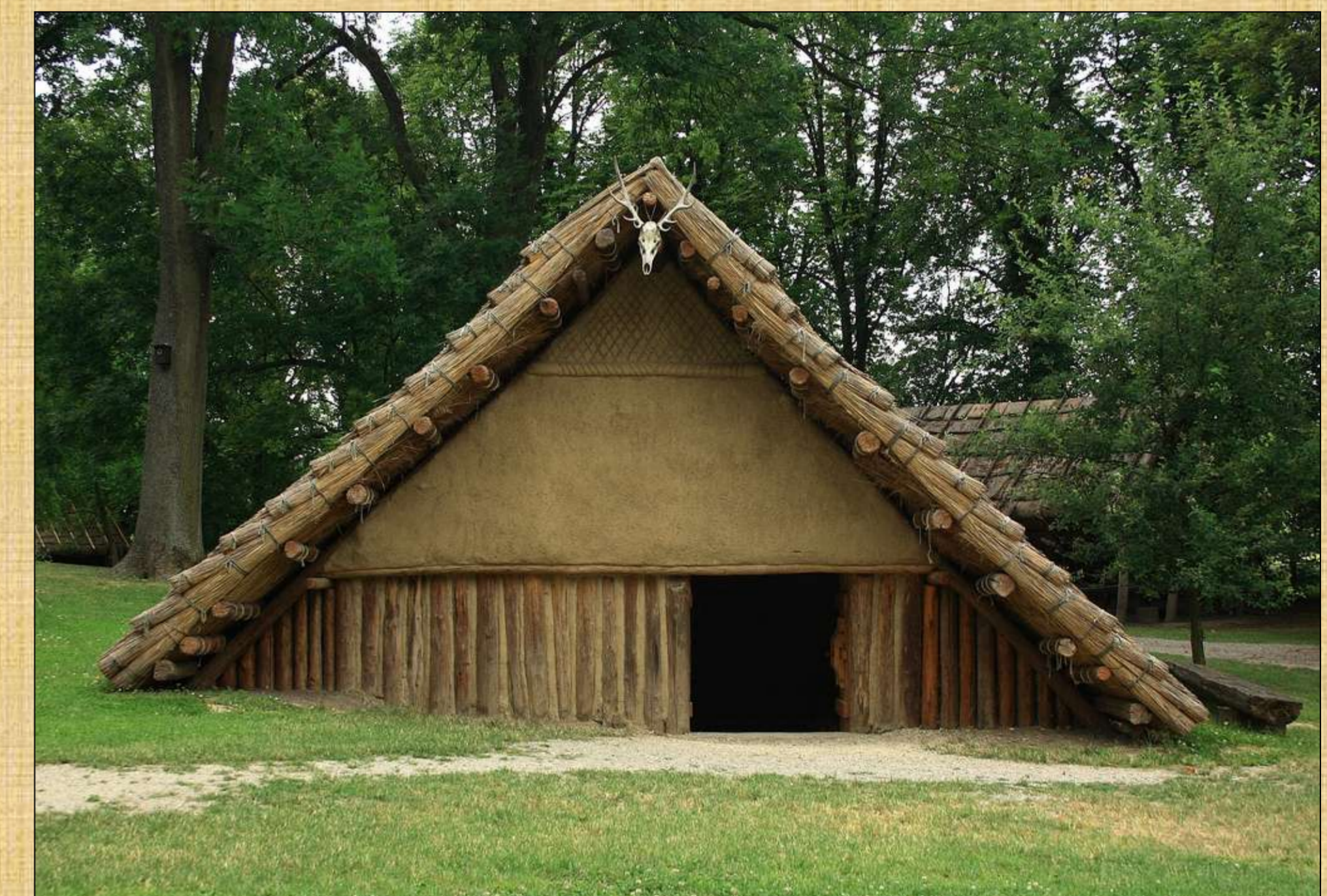
Ideální rekonstrukce polozahloubené chaty ze starší doby železné (Archeologický skanzen Asparn an der Zaya, Dolní Rakousko)