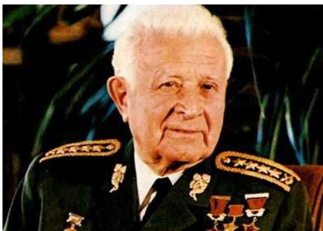
Armádní generál Ludvík Svoboda

Před 40 lety zemřel skutečný hrdina, který osvobodil Československo