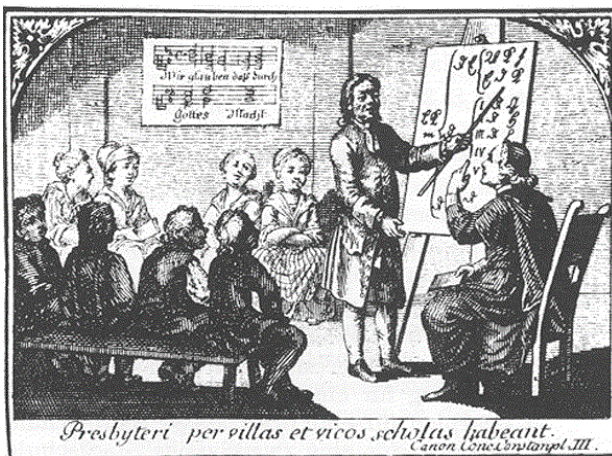
Presbyteri per villas et vicos scholas habeant. Canon Conc. Constant. III.

Komunistický puč v únoru r. 1948 znamenal samozřejmě definitivní konec všech církevních škol. Násilně tak byl završen proces postátňování školství jako celku, který ovšem započal již v polovině 19. stol. Po roce 1953 se jednotná státní škola stala klíčovým nástrojem ideologické propagandy totalitní moci, díky které se náboženská složka výchovy institucionálně i pedagogicky vytlačovala za hranice legality.