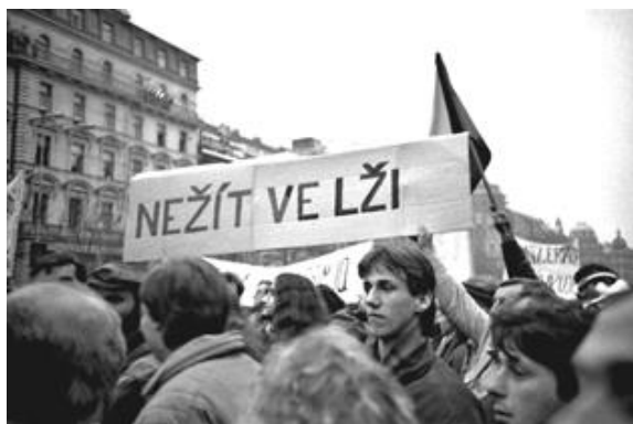
Foto z roku 1989