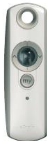
Telis 1 Modulís RTS přenosný jednocanálový ovladač pro ruční ovládání. Komfortní ovládání sklonu lamel pomocí nastavovacího kolečka.

Dálkový ovladač - 1 kanálový s možností naklápění lamel