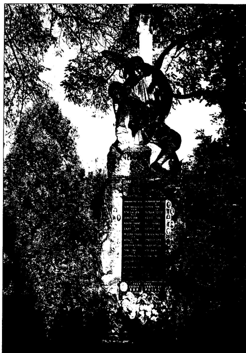
Pomník u kostela sv. Maří Magdalény