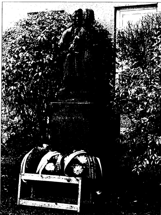
Pomník před školou na velickém náměstí