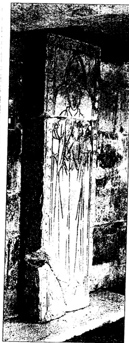
Náhrobek probošta Alexia

Text zní: „+ ANNO / · DOMINI / · M · CC · LXXXII · VIII · KD · VI [ - - - ] / · Ø · DOMNV / S · AL [EXI] VS · PREPOSITVS · [O] LOMVNCEN / SIS //“