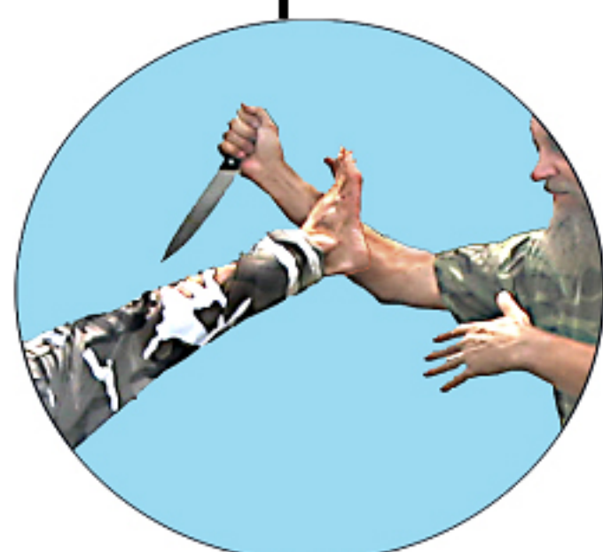
Detail Správné krytí

1. Krytí útoku lze provádět buď pouhým Li-Chei-Tui nebo ve výskoku. V každém případě je životně důležité krytí předloktí, nikdy nůž nebo vnitřní část loktu.