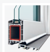
práh dveřního systému