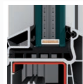
zasklení okenního křídla