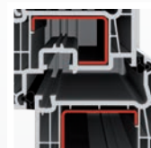
dorazové těsnění okenního systému