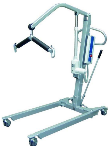
Zvedák elektrický, pojízdný 300,-kč / měsíc