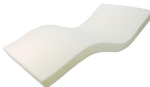
Postelová pěnová matrace 150,-kč/ měsíc