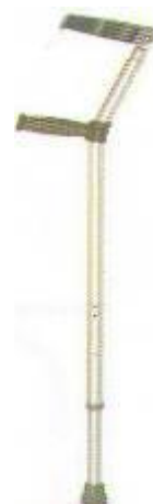
Francouzská hole 50,-Kč/ měsíc