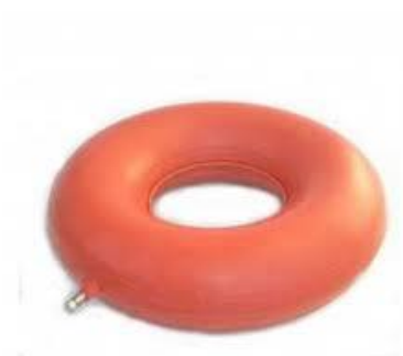
Antidekubitní kruh 50,-kč/ měsíc