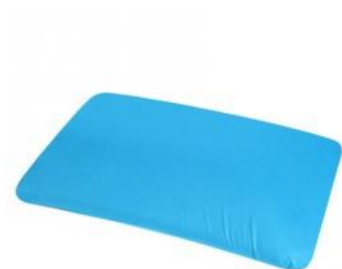
Antidekubitní podložka 120,-kč/ měsíc