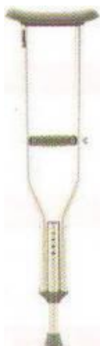
Vysoká berle podpažní 50,-Kč/ měsíc

Cena za půjčení pomůcky - půjčované je vždy dle aktuálního ceníku k dispozici na webových stránkách.