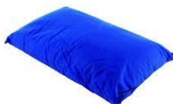
Antidekubitní podložní polštář 120,-kč/ měsíc