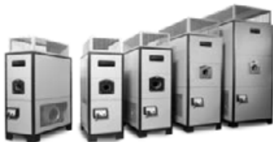
HP30 - HP250