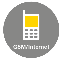
Report a ovládání